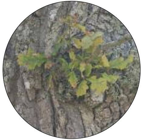
Det gamle træ - med blade på...