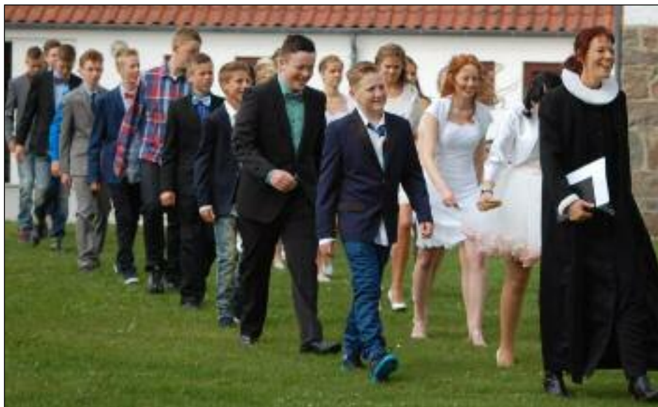
En flok glade og spændte konfirmander på vej i kirke med en ligeså glad præst i spidsen.