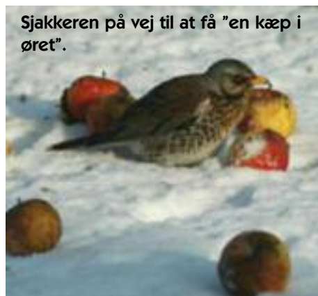
Sjaggeren på vej til at få "en kæp i øret".

Hvert år kommer store mængder af sjagger og silkehaler flyvende hertil fra Norge og Sverige. Begge fuglearter optræder ofte i meget store flokke, som bl.a. kan ses i haver og parker.