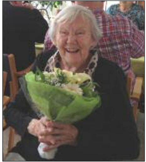
Tillykke - tillykke med de 90 år!