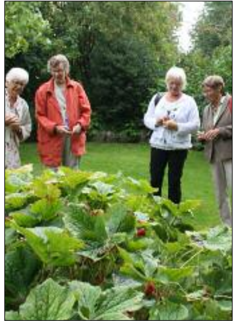
De smukke blomster og planter i "Laden og Vejruphave" bliver her beundret.

Hvert år giver vores menighedsråd besøgsvenner og ledsagere en udflugt, som tak for det store arbejde, alle de frivillige laver.