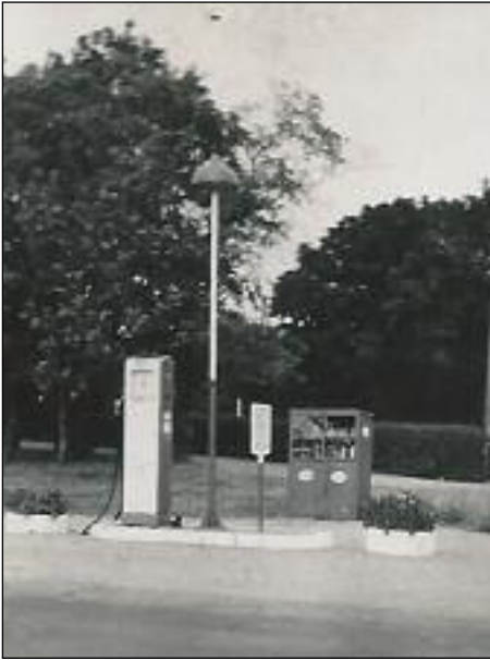
Benzintanken, som hørte til købmands-butikken, lå på den modsatte side af Mejlbyvej. Billedet er fra 1954.