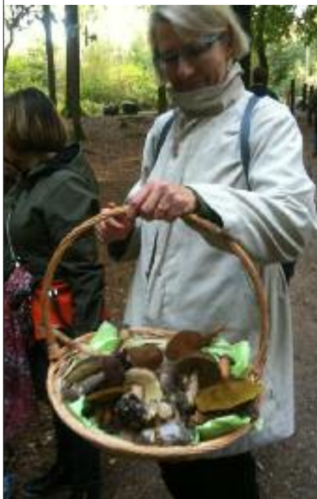
Billeder fra sidste års velykkede svampetur.