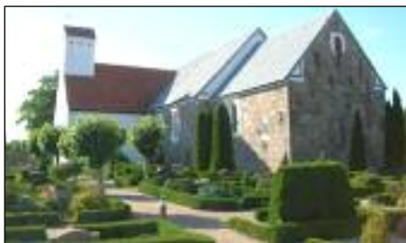
Turen går sikkert forbi Todbjerg kirke.

Todbjerg-Mejlby Lokalhistoriske Forening