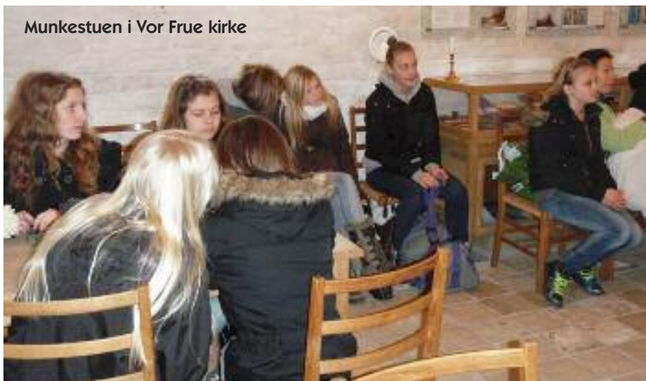
Munkestuen i Vor Frue kirke