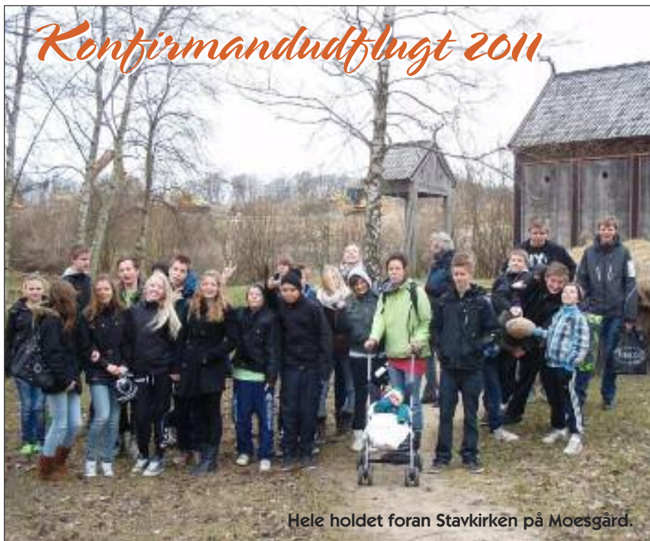
Hele holdet foran Stavkirken på Moesgård.