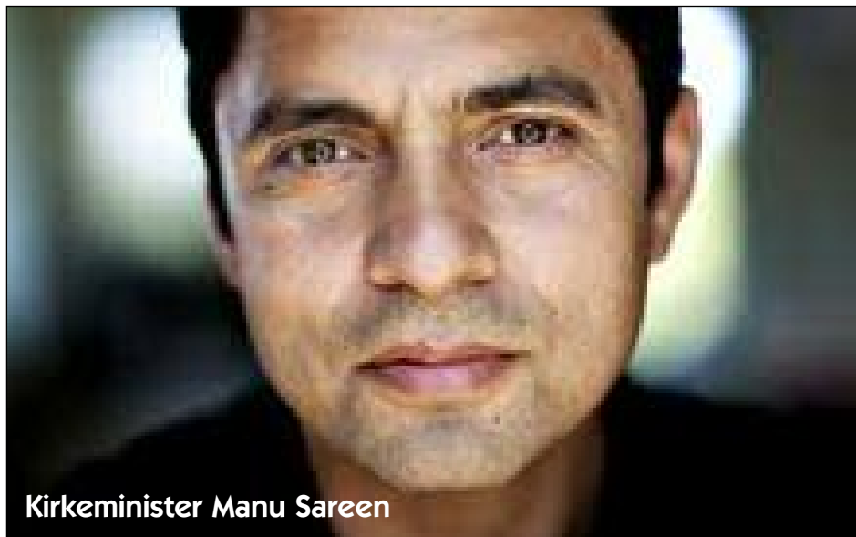
Kirkeminister Manu Sareen

Hvert fjerde år er der valg til menighedsrådene landet over.