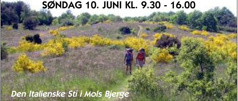
Den Italienske Sti i Mols Bjerge