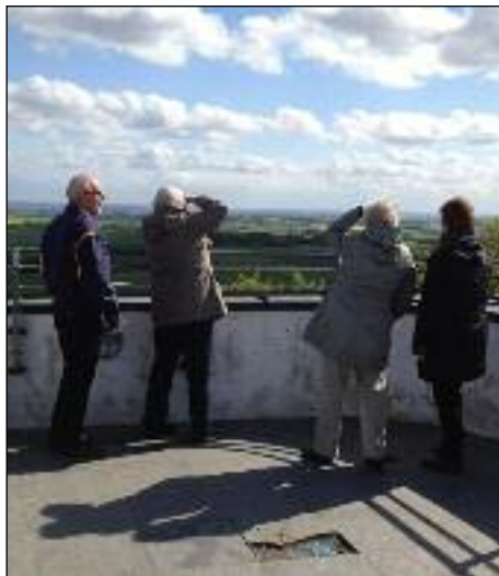
Her nydes den smukke udsigt fra tårnet på Ejer Bavnehøj.

Vestenvinden, blev der dækket op til kaffe - og kage bord. Underholdning fik vi i form af et par atletiske kitesurfere.