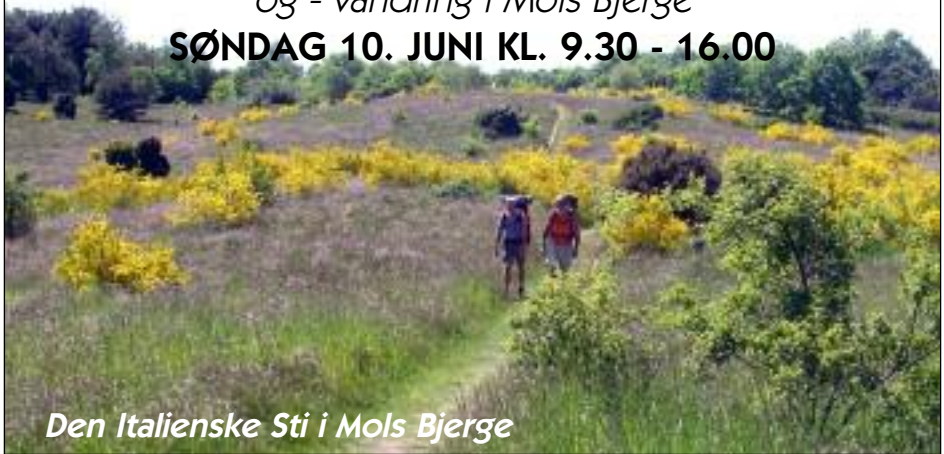
Den Italienske Sti i Mols Bjerge