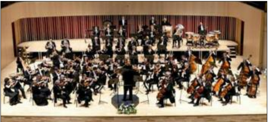
14 af disse medlemmer af Aarhus Symfoniorkester kommer og underholder i Hjortshøj Lokalcenter Torsdag den 14. april.